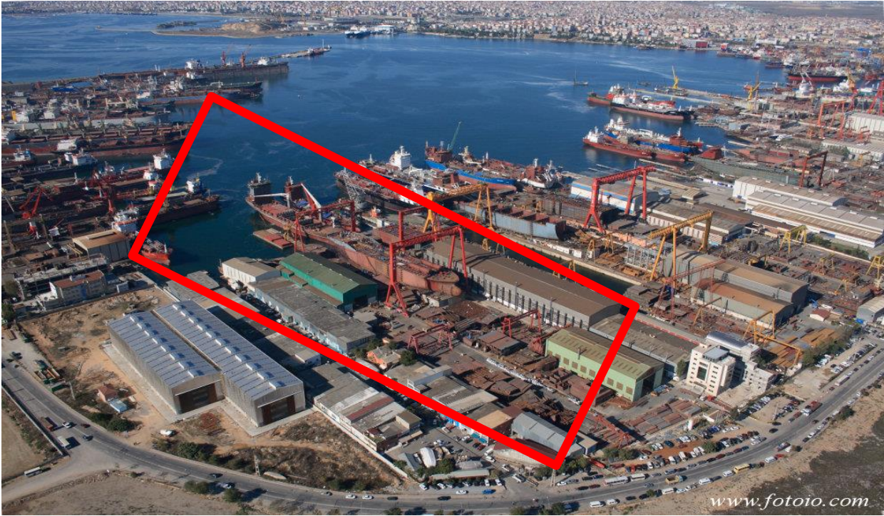
Tuzla Tersaneler bölgesinde Anadolu Tersanesi

Anadolu Deniz İnşaat Kızakları Sanayi ve Ticaret A.Ş. (A.D.İ.K) 1981 yılında Tuzla Tersaneler bölgesine taşınmış olup burada yeni gemi inşasına ve gemi bakım onarımına devam etmiştir. 15.250 m 2 'si kapalı olmak üzere toplam 44.659 m 2 alana sahip olan Anadolu Tersanesi alt yapısında net boyları 137,5 m ve 92, 5 m olan 2 kızak, iki kapalı blok imalat sahası, sac kesim atölyesi (CNC) ve boyama tesisi olmak üzere toplam 4 kapalı atölye, açık blok imalat sahaları, sac ve profil istif sahaları, idari binalar, malzeme deposu, kreynler, forkliftler, kaynak makineleri ve CNC sac kesme tezgahı mevcuttur.